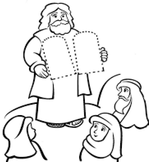
MOISÉS E OS DEZ MANDAMENTOS

TRAGA SEU FILHO PARA EVANGELIZAÇÃO E MOCIDADE DA CCHJ!