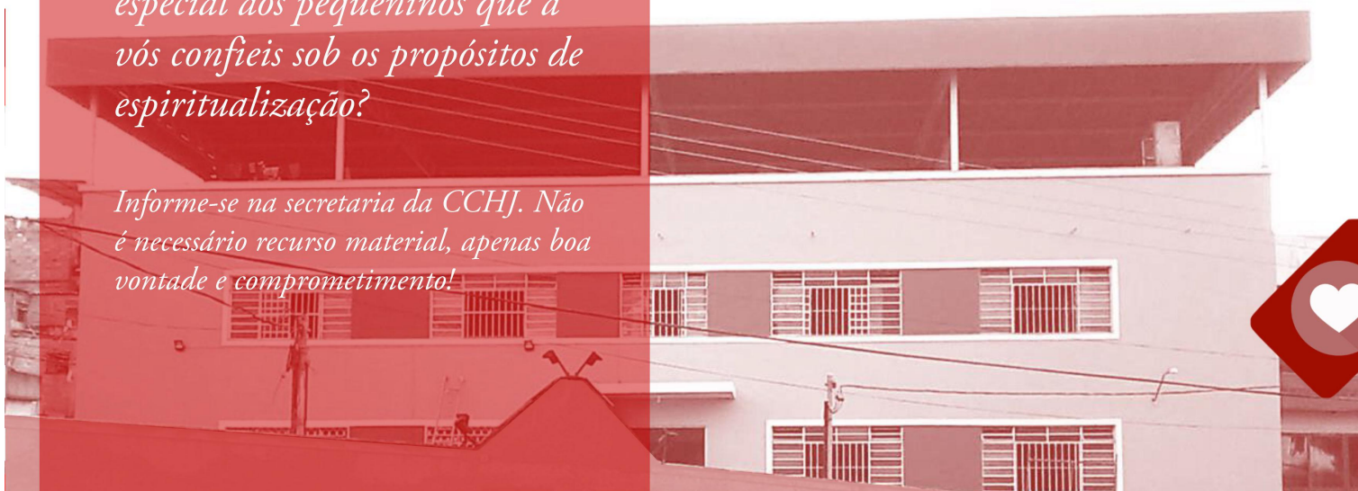
Foto: Fachada dos Lares Esperança Francisca de Paula de Jesus, unidades 1 e 3, mantidos pela CCHJ.

Do livro Antologia dos Imortais, obra psicografada pelos médiuns Francisco Cândido Xavier e Waldo Vieira, de autoria de Espíritos diversos.