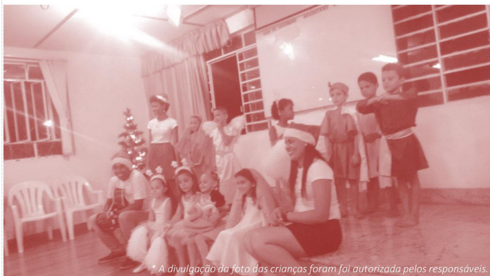
* A divulgação da foto das crianças foram foi autorizada pelos responsáveis.